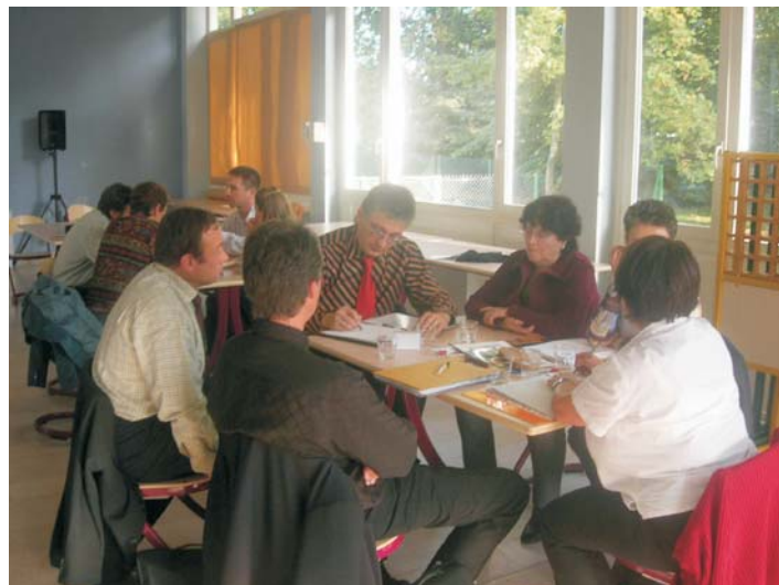
Séminaire octobre 2006 à Semur en Auxois équipes pédagogiques du lycée hôtelier François Rabelais de Dardilly et de la Gertrud-Luckner-Gewerbeschule de Freiburg

Ce projet, soutenu financièrement et pédagogiquement par le Fonds Social Européen, met en place plusieurs actions, les unes visant à assurer aux jeunes en formation professionnelle les conditions nécessaires à un stage de mobilité en Allemagne, les autres à accompagner les équipes enseignantes dans leur projet et les dernières à élaborer des outils pour améliorer le cadre de la mobilité et de sa préparation.